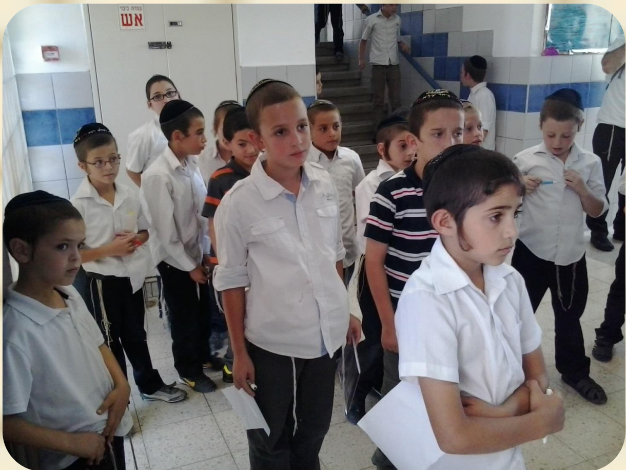
בהוראות לקראת מבצע הכנה לג' תמוז