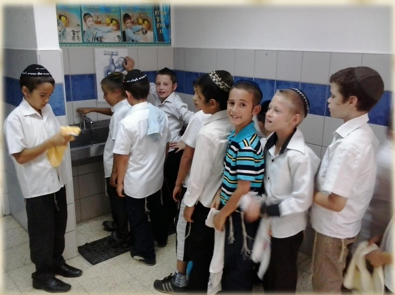
תורן הכיתה דואג כי התלמידים יטלו את ידיהם בהידור. עם מגבת.