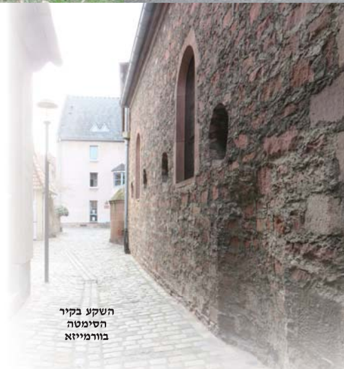
השקע בקיר הסמטת בוורמייזא

בית הכנסת שוקם ושוחזר בידי עיריית וורמס בשנת תשי"ט, על פי צילומים ותוכניות שנשמרו בארכיוני העירייה. אנו צועדים עתה לעבר בית מקדש מעט היסטורי זה, ופוגשים קודם לכן באגדה נוספת, בשער של העיר העתיקה ששמו הרשמי הוא "נאשירטור" — שער רש"י. על פי המסורת, נפגש רש"י עם הנסיך גוטפריד מביוון, ממנהיגי מסע הצלב הראשון ולשאלת הנסיך כיצד ישוּב המסע, השיב רש"י כי יחזור עם שלושה סוסים בלבד. נבואת רש"י כמעט התגשמה ומכל צבאו לא נותר לו כי אם ארבעה מלוים. סר וזעף עמד הלה להיכנס אל העיר כשלתפע נזכר בדבריו של רש"י שצפה לו את המפלה. חרונו עלה בו להשחית והוא ביקש להתנקם ברב היהודי. הוא גם מצא לו עלילה, הנה הוא חזר עם ארבעה מלוים ולא עם שלושה כדבריו. כיוון אפוא את פמלייתו אל שער העיר לעבר רחוב