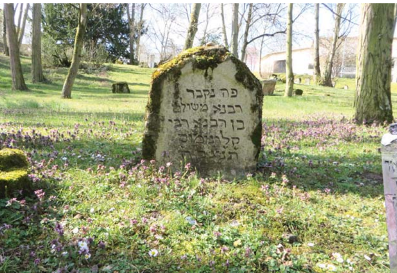
משמאל: רבנא משולם בן רבנא קלוימוס. בית החיים במגנצה