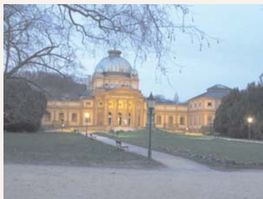
כרי דשא, שבילים ומרחצאות הגנים המרהיבים בבאד הומבורג