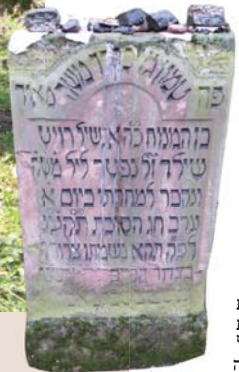
קברו של ר' מאיר אנשל רוטשילד, אבי משפחת רוטשילד

היהודים. והיא בחולפו תחת השער, נפלה לבנה ממעל והרגה את הסוס הרביעי. לזכר הנוס קוראים לשער מאז ועד היום שער רש"י.