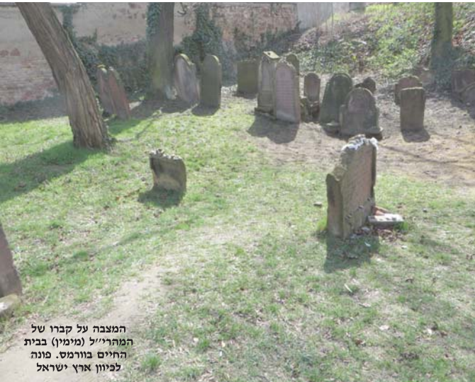
המצבה על קברו של המורה ר"ל (מימין) בבית החיים בוורמס. מנה לפיון ארץ ישראל