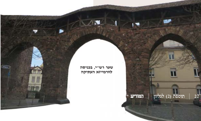
שער רש"י, בכניסה לוורמייזא העתיקה

יהודי לאביו שבשמים, ובת קול נסתרת 'לבלתי ידח ממנו נידח' פיעמה באוזני..."