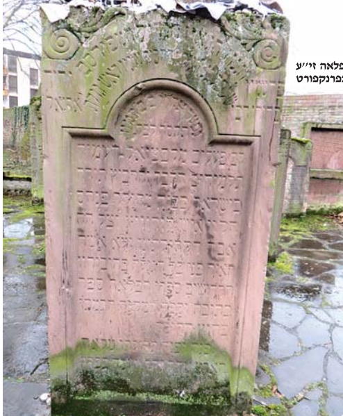
מצבת ציונו של הרח"ק רבי מנחם בעל המפלאה זי"ע בבית העלמין העתיק בפרנקפורט

השער מצאנו כמובן נעול. שום שומר לא נראה באופק, ולך תחפש עכשיו מפתח בלי לדעת כתובת ושפה. המוצא היחיד היה טיפוס על השער הגבוה, מעשה לא מקובל בעליל במעוז הקיים המהוקצע. אבל כשאין ברירה או אין ברירה, וזה מה שעשינו בסופו של דבר אל מול עיניהם הנדהמות של כמה גרמנים שנשמחם כמעט ונעתקה למראה היהודים על הגדרות. בשטח התבררה המשימה כלא ממש פשוטה. אין שום רמז למיקומן של המצבות, ולולא שידענו קודם לכן כי ציונו של רבינו גרשום ממוקם לא הרחק מן השער, קרוב לוודאי שלא היינו מאתרים את המצבה. אכן עתיקת יומין ונמוכת קומה שאותיה השבורות זהו כבר מזה עידן ועידן, זהו ציונו של המאור הגדול עליו כותב הר"ש בתשובותיו (כלל מג סימן ח) כי "תקנתיו וגזרותיו קבועות ותקועות כאילו נתנו מסיני". עגום וכואב, וממש תואם את מלותיו של רבינו גרשום עצמו בפיטו הנאמר בסליחות "העיר הקדושה והמחוננת, היו לחרפה ולביזות וכל מחמדיה טבועות וגנוזות".