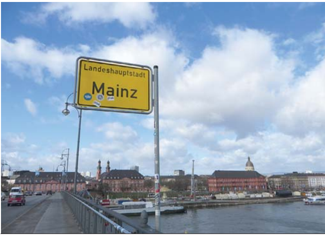
העיר מיינץ - מגנצה

ישראל: רח' אושישקין 57, ירושלים 02-625-8258 ארה"ב: 315-53 St. Brooklyn, N.Y 11219, 718-305-5480