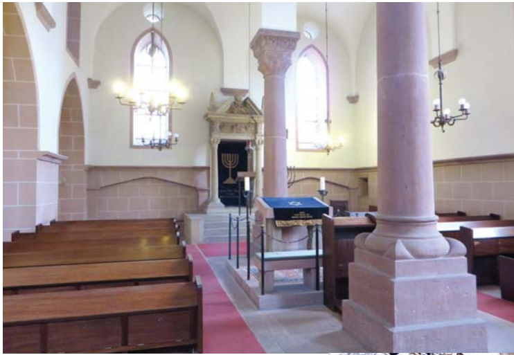
היכל בית הכנסת של רש"י ב'ורמייזא. נוסד לפני כאלף שנה. נחרב ושוקם כמה פעמים לאורך ההיסטוריה