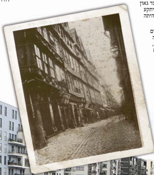
י'ודן-נאסה' - סימטת היהודים בפרנקפורט.

גדולי ישראל אחרים הספונים בבית עלמין זה אשר מקום ציונם אבד, הם הגאונים הצדיקים המהר"ם שיף, רבי יוסף שמואל מקראקא, בעל 'מסורת הש"ס', רבי שמואל שאשין, בעל 'כוס הישועות', הגאון רבי אברהם ברודא, גדול ראשי הישיבות ברורו ועוד, זכר צדיקים לברכה. שטח בית העלמין כיום הוא חלק מהמוזיאון היהודי השוכן בסמוך, הממוקם בחווילתו לשעבר של ר' מאיר אנשיל רוטשילד. את חומת בית העלמין מעטרים אחת עשרה