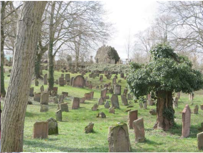
בית החיים ב'ורמייזא (וורמס) העתיק ביותר באירופה