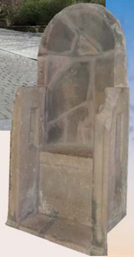
הכסא של רש"י עליו על פי המקובל לימד את תלמידיו

מהימנותן, רק נהלה כאורחים רצויים ב"יודן-גאסה" הוא רחוב היהודים ונדאה על כנפי ההיסטוריה אל הדורות שהתהלכו כאן לפני יותר מאלף שנים ועד למלחמת העולם השנייה.