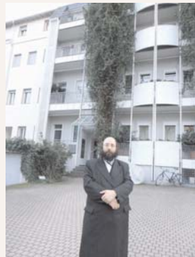
כאן הוקמה "אגודת ישראל". כתובת ביתו של הרב ד"ר קוטיק זצ"ל רבה של באד הומבורג