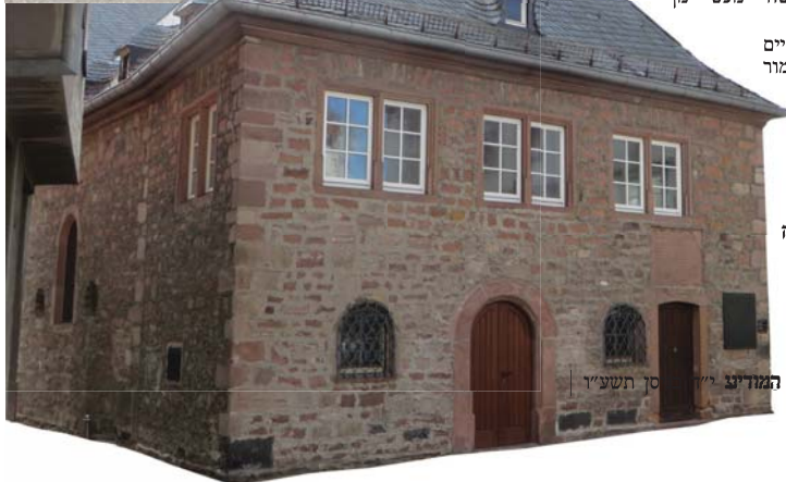
בית החיים מגודר ושומר היטב. חזית בית הכנסת העתיק ב'ורמייזא

קורמת עור וגידים בעוברך על יד אחת היטומאות' הגדולות והשחרורות של העיר. מהימנותה של האגדה כמו גם מקורה אינם ברורים, אך אין ספק כי רקע התקופה ומצבם הבישי של יהודי מנגנצא, שימשו מקור נפלא להשראת סיפורים אלו.