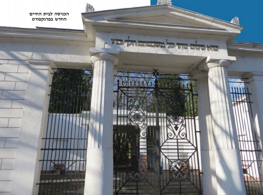
הכניסה לבית החיים החדש בפרנקפורט

הקהילה היהודית המשיכה להתקיים, ומעטים מאוד היו היהודים שהצליחו לשמור על הגחלת. מי שהפיח רוח חיים בקהילה הפינקפורטית היה רבי שמשון רפאל הירש זצ"ל, שהשכיל להוציא יקר מזולל וניחב את קהילתו שקומם מאשפתות בין הטיפות העכורות שהכתירו את ימיה של קהילה עתיקת יומין זו