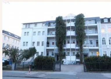
טיילת הקיסר פרידריך 11-9 באד-הומבורג. בכתובת זו התקיימה "ועידת הומבורג" בקיץ שנת תרס"ט, אז הוכרז על הקמת תנועת "אגודת ישראל"