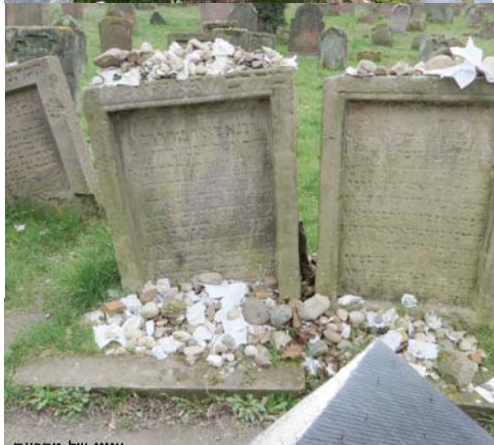
ציונו של מהר"ם מרוטנבורג (משמאל) בסמוך לו פודה עצמותיו.

בעקבות מאורעות אלו שפקדו את קהילת שו"מ –