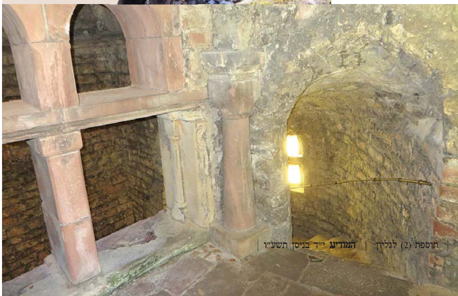
המדרגות למקוה של רש"י – העתיקה באירופה

"וגם בדורו לא היה כמותו מופלג ובקיא, וידע דעת כל הקדמונים", כך כותב עליו בעל 'הגהות מיימוני' בהל' פסח ומצה. המהרש"ל בחיבורו על הש"ס כמתבאר עליו "איש עניו וטהור אשר אין באחרונים כמוהו". המהרש"ל גם מביא בספרו 'ים של שלמה' עמ"ס גיטין, את עובדת תפיסתו ככלא: "שמעתי על מהר"ם מרוטנבורג ד"ל שהיה תפוס במגדול אייגהם כמה שנים, והשר הבטע מן הקהילות סך גדול והקהילות היו רוצים לפדותו ולא הניח כי אמר אין פודין את השבויים יותר מכדי דמיהם".