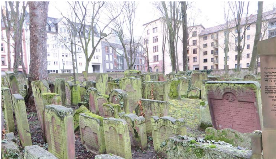
בית החיים הישן בפרנקפורט