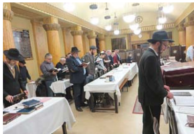
יהודי פרנקפורט בתפילת מנחה

צריחי המגדלים של מנצא העתיקה ובתי יראתם הממלאים את נופה מאופק לאופק, מעבירים אותך באחת אלף שנים לאחור, אל התקופות בהן יהודי מנצא היו נתונים למשיסה בידי הבישופים וההגמונים ששלטו בעיר. האגדה הידועה על רבי שמעון הגדול ממנצא, מגדולי דורו ומחבר הפיוט "ברוך ה' יום יום" המושר בסעודת צפרא דשבתא, אודות בנו אלחנן, שנחשב בילדותו על ידי הכנסייה וגדל בתחומיה עד שנעשה לאפיפיור,