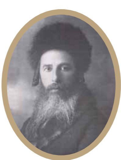
הגאון רבי חיים לייב אויערבאך