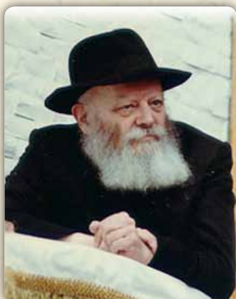
כ"ק אדמו"ר רבי מנחם מענדל מליובאוויטש ז"ע