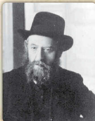
הרה"ק רבי שלום דובער הרש"ב מליובאוויטש ז"ע