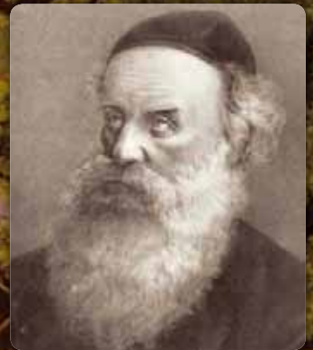
הרה"ק רבי שניאור זלמן מלאדי בעל התניא ז"ע