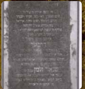
מצבת הרה"ק האדמו"ר האמצעי ז"ע