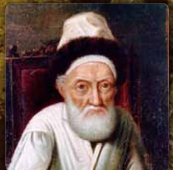
הרה"ק רבי מנחם מענדל מליובאוויטש ה"צמח צדק" ז"ע