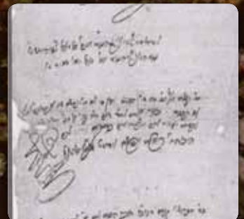
כת"י הרה"ק המהר"ש מליובאוויטש ז"ע