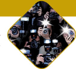
(מעובד ע"פ לקו"ש ח"ג עמ' 1011)

זהו, הבנתי. מהיום אשתדל עוד יותר לעזור לכל יהודי וללא בקשת תמורה!