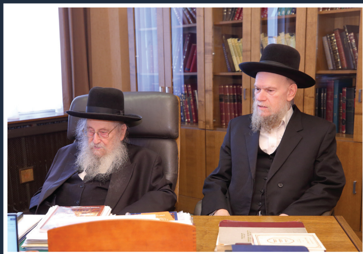
עם הדומ"ץ הגרי"ד שמאהל שליט"א בלשכת הוראה