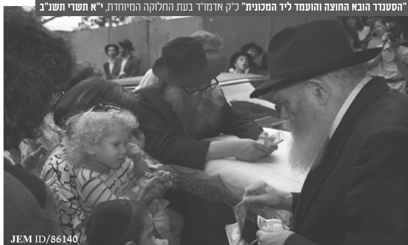
"הסטנדר הובא החוצה והועמד ליד המכונת" כ"ק אדמו"ר בעת החלוקה המיוחדת, י"א תשרי תשנ"ב

לתפילת שחרית היום נכנס כ"ק אדמו"ר שליט"א מעט מאוחר מן הרגיל. מעט זמן לאחר תפילת שחרית נודע לקהל ההוראה המפתיעה - טרם צאתו של כ"ק אדמו"ר שליט"א למקוה ביקש להודיע, אשר לאחר שובו מהמקוה טרם צאתו לאהל תתקיים חלוקת דולרים מיוחדת לילדים וילדות טרם בר ובת מצווה, ריל"ג ירד לבית הכנסת והודיע לקהל את ההודעה המרעישה הנ"ל והוסיף אשר כ"ק אדמו"ר שליט"א ביקש לפרסם על דבר החלוקה המיוחדת