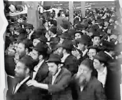
"שאקעלדיקערהייט" - ריקודים סוערים לפני כניסתו של הרבי לסליחות