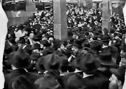
הקהל העצום בעת אמירת הסליחות