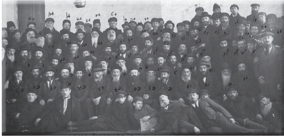
ועידת הרבנים בקורוסטן