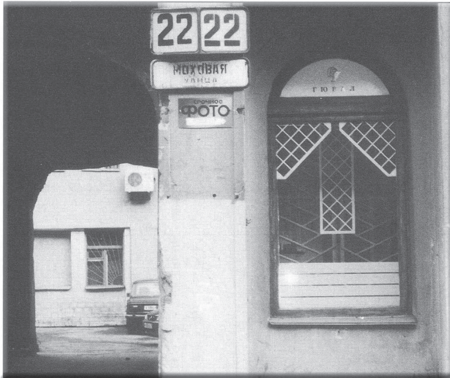
בית אדמו"ר הריי"צ - רחוב מאחווייה 22

משפחתו ברוסטוב. הרבי התגורר בתחילה באחד המלונות הגדולים בעיר. חסידים רבים התגוררו קרוב יותר ללנינגרד מאשר לרוסטוב והם שמחו על שהרבי עבר לגור בלנינגרד. במהלך השבועיים הראשונים מאז הגיע הרבי לעיר, באו אל הרבי המוני חסידים. כשהתקרב חג השבועות, ביקש הרבי שהחסידים ימנעו מלבוא אליו בחג השבועות, מחשש עינא בישא של השלטונות, ובכל זאת חסידים רבים הגיעו לקראת החג.