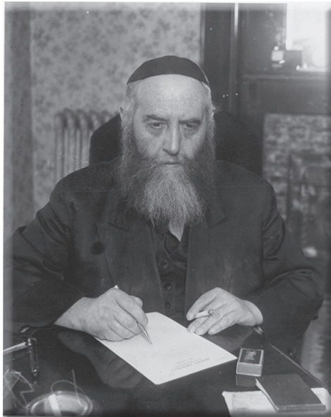
כ"ק אדמו"ר הריי"צ

צדיק בא לעיר. בשלהי חודש אייר תרפ"ד (1924), עבר אדמו"ר הריי"צ מליובאוויטש ממקום מגוריו ברוסטוב וקבע את מושבו בלנינגרד. כשלוש שנים גר הרבי הריי"צ בעיר, במהלכן היתה למרכז חסידות חב"ד. עיני כל חסידי חב"ד היו נשואות ללנינגרד, וחסידי רבים פקדו את לנינגרד כדי לחסות בצילו של הרבי בימים טובים, ביומי דפגרא חב"דיים, וגם בעת צרה, כאשר ביקשו ברכה לישועה והצלה. מלנינגרד נוהלה על ידי הרבי מערכת עניפה של פעילות יהודית-חסידית, למורת רוחו של השלטון הקומוניסטי.