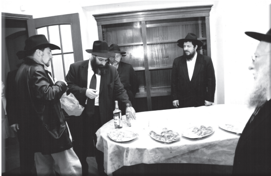
ביקור בבית אדמו"ר הריי"צ. מימין לשמאל:

המכתב החריף אמור להישלח בצורה גלויה ופומבית "לרבים השואלים ודורשים על אודות 'אסיפה דתית הכללית' הנקראת מטעם קהילת לענינגראד", והרבי כותב בו מפורשות כי הנוטל חלק בועידה נלחם בתורת ישראל: