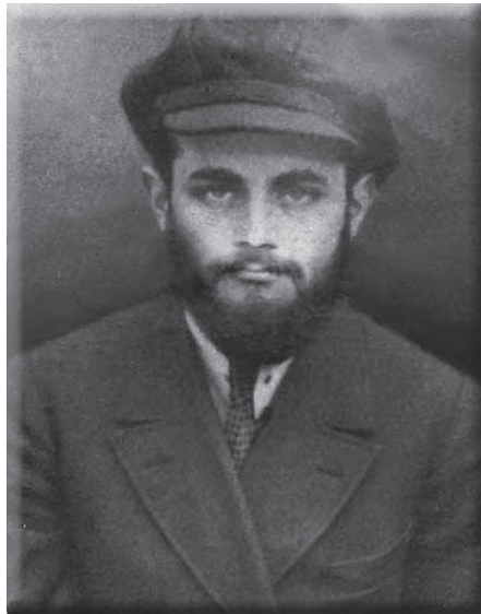
כ"ק אדמו"ר נשיא דורנו בצעירותו

מאז שהגיע הרבי הריי"צ ללנינגרד, החל המיועד להיות חתנו, הרב מנחם מענדל שניאורסאהן - לימים הרבי מליובאוויטש, להגיע תדיר לעיר ולפקוד את בית חמיו לעתיד, שהכניסו עד מהרה לעבודת הכלל והטיל עליו תפקידים ציבוריים חשובים.