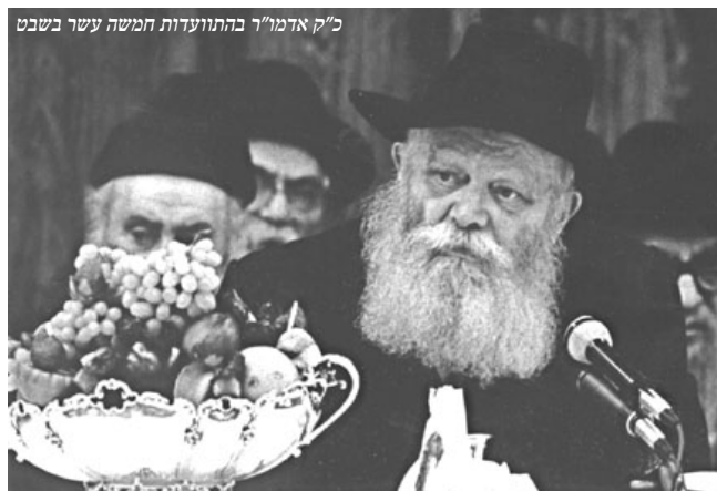
כ"ק אדמו"ר בהתוועדות חמשה עשר בשבט

יומן מתקופת י"א-י"ז שבט ה'תשנ"ב - כקביעות שנה זו