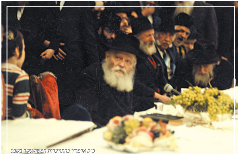
כ"ק אדמו"ר בהתוועדות חמשה עשר בשבט

תפילת מעריב התקיימה ב-6:45 בזאל למעלה, כיון שאת הזאל