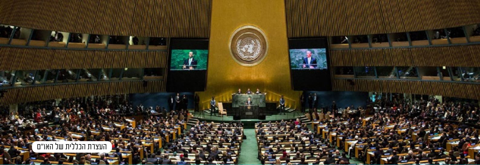
העצרת הכללית של האו"ם