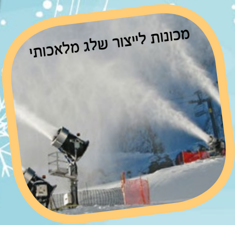
מכונות לייצור שלג מלאכותי

לא אחת אנו קמים בבוקר ולכל מלא העין רק לבן, ולבן... עם כל מעלותיו וחסרונותיו, השלג היה ונשאר אחד מסמלי החורף המובהקים, ולמראה מרתק ביופיו. וגם כאן, יש הוראה בעבודת ה'.