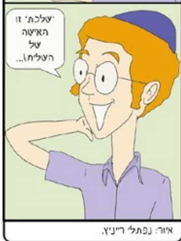
איור: נפתלי רייניץ.

פטרונות ניתן לשלוח: ללוי גורליק, לכתובת המייל של העיתון, או להניח בתיבת 'החילוקי', ולהשתתף בהגרלת פרסים ביום שישי!