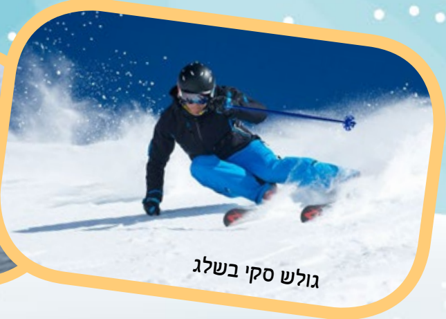
גולש סקי בשלג