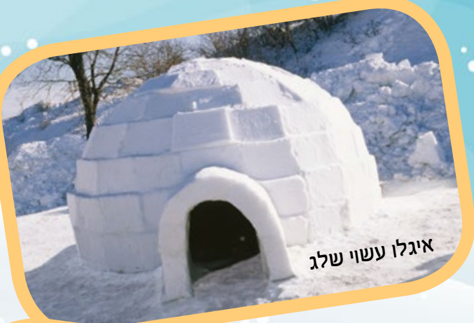
איגלו עשוי שלג

על חסיד להיות אדם חי, רותח ולוהט, בשביל להשיג את המטרה!