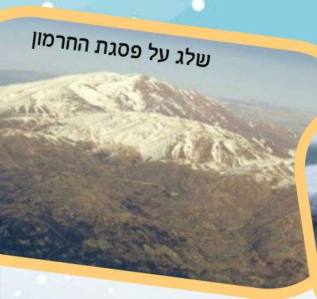
שלג על פסגת החרמון

לא אחת אנו קמים בבוקר ולכל מלא העין רק לבן, ולבן... עם כל מעלותיו וחסרונותיו, השלג היה ונשאר אחד מסמלי החורף המובהקים, ולמראה מרתק ביופיו. וגם כאן, יש הוראה בעבודת ה'.