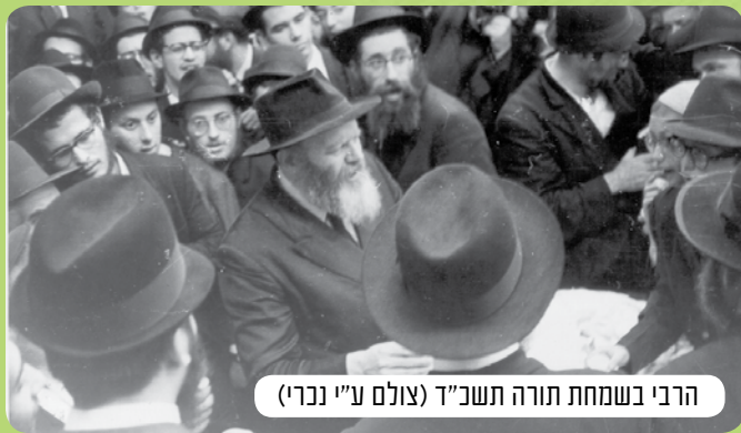
הרבי בשמחת תורה תשנ"ד

הרבנים והשלוחים נגשו לארון הקדש ונטלו את ספרי התורה,