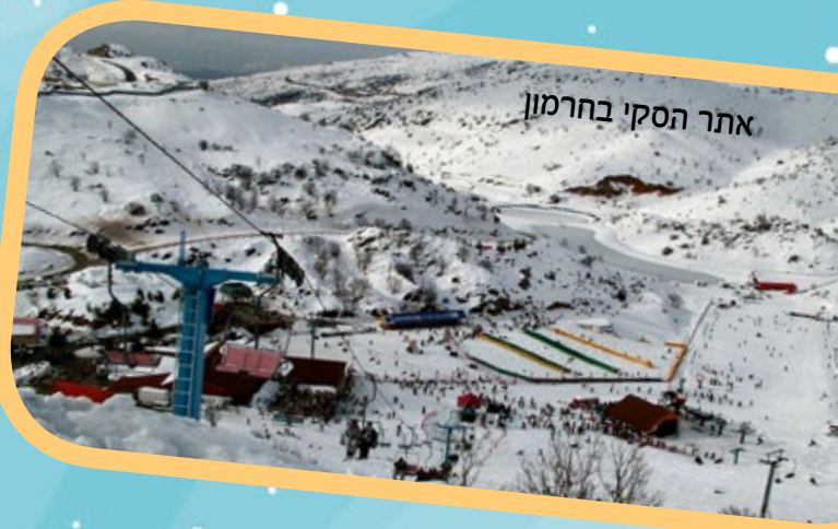
אתר הסקי בחרמון

אך עוד לפני כן, נרשמו עוד חורפים היסטוריים, שבהם השלג שירד בארץ ישראל לא ידע גבול: