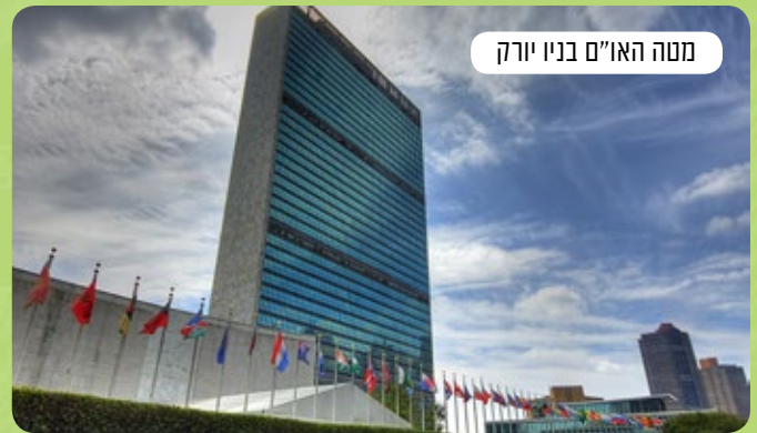
מטה האו"ם בניו יורק