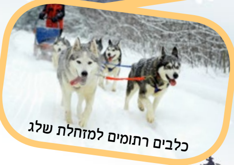
כלבים רתומים למזחלת שלג