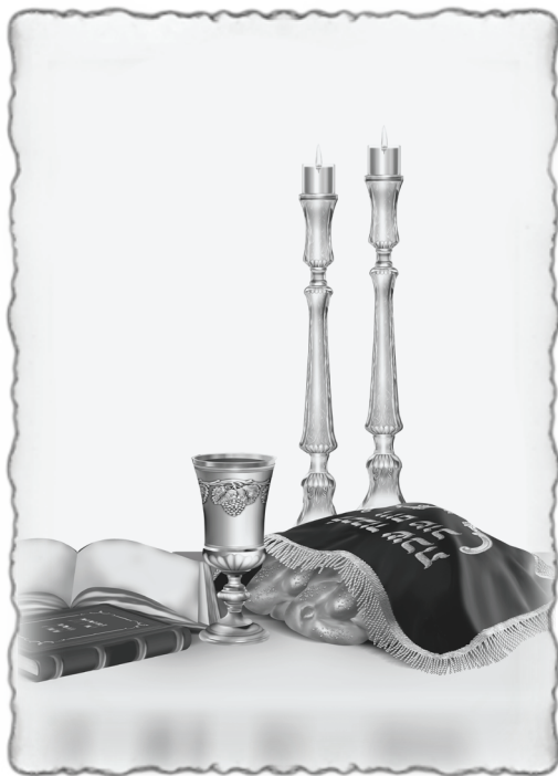
נרות שבת קודש

זאת לומדים, אומר 'בעל הטורים', מהמלה "תצוה" השווה בערכה למלים "נשים צוה" (=501), ומכאן שהציווי על הדלקת נרות שבת מיועד בעיקר לציבור הנשים. בספר 'שני לוחות הברית' מביא רמז זה ולומד ממנו הוראה מעשית - נרות הנשים שמדליקות הנשים יהיו משמן זית, כשם שבפסוק כאן מדובר על "שמן זית זך" [למעשה, מסיבות שונות הדבר לא מיושם בחלק גדול מקהילות ישראל הנוהגים להדליק בנרות שעווה או חלב ולא בשמן זית, ולא כאן המקום להרחיב בכך].