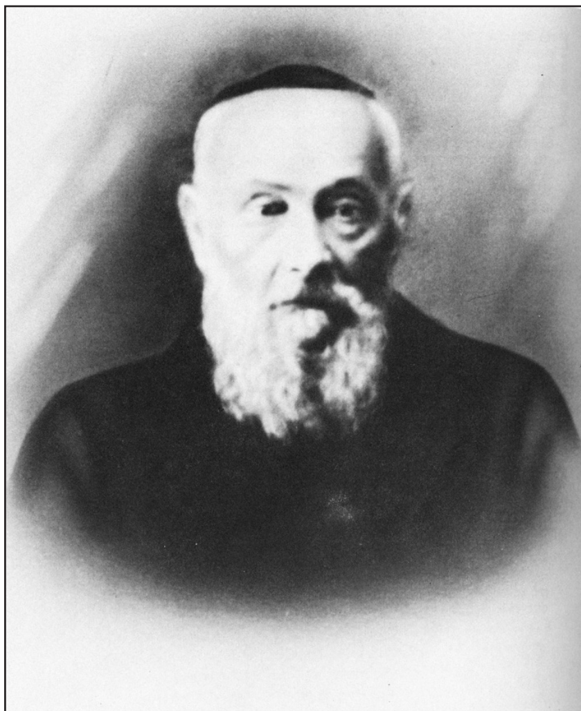
תמונת כ"ק הרה"ג הרה"ח והמקובל וכו' מוהר"ר לוי יצחק זצ"ל שניאורסאהן (בגלות ציילי)