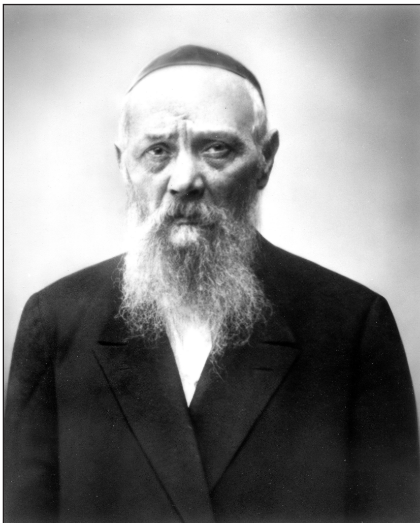
תמונת כ"ק הרה"ג הרה"ח והמקובל וכו' מוהר"ר לוי יצחק זצ"ל שניאורסאהן (בעת שנלקח למאסר – בשנת תרצ"ט)