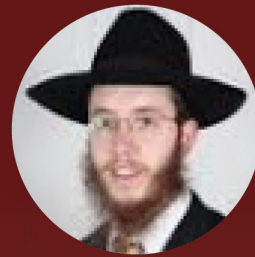
משפחת בוטמן פנום פן, קמבודיה