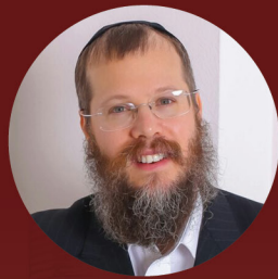
משפחת דייטש פערם, רוסיה