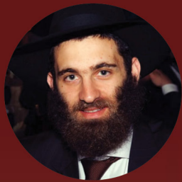
משפחת ליצמן סיאול, דרום קוריאה