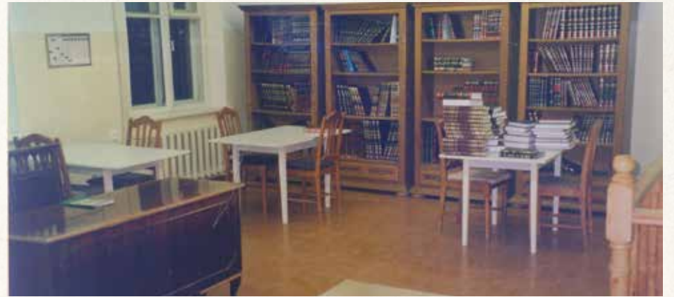
ה"קאבינעט" - חדר הלימוד של אדמו"ר הרשב"ב, שהוסב בשנים האחרונות לבית מדרש מתוך הספר "בתוך הגולה", המתאר את תקופת שהותו של אדמו"ר הרשב"ב ברוסטוב

"איני מתפעל מהם עכשיו. במצב כמו זה שבו אני עומד כעת, אינני מתפעל מהם כלל. בפעם אחרת אולי הייתי מתפעל, אולם במצב שבו אני עומד כעת איני מתפעל מהם כלל..."