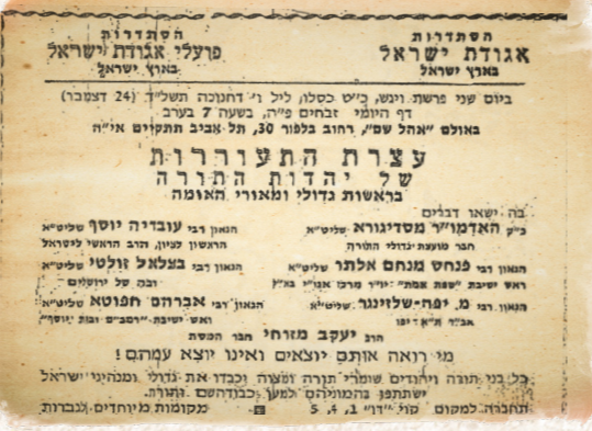
נואם בעצרת הת עורורת בתל אביב, יחד עם מנהיגי אגודת ישראל

נואם באספת עם בצפת, מפעולותיו הראשונות במסגרת אגודת ישראל.