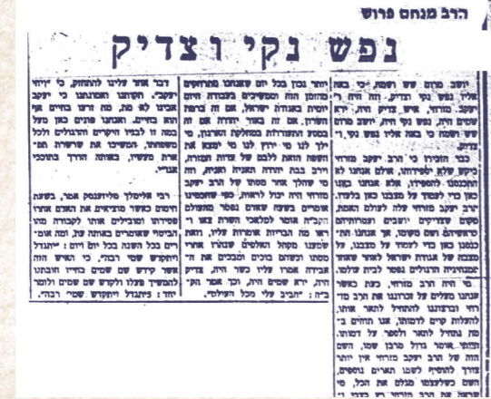
הרב מנחם פרוש, המודיע תשרי תשמ"א

בנאומו הזכיר את דברי ראש הממשלה אשר הביעה דאגה עמוקה מההתבוללות בגולה, ועל כך תמה: "האם מה שרואה התייר כאן יכול לעצור את ההתבוללות? כדי למנוע את ההתבוללות יש להראות לתיירים את ההווה היהודי המקורי, להראות להם את ההתיישבות החקלאית השומרת על המצוות התלויות בארץ ומקיימת את מצוות השמיטה, להראות להם כפרי נוער דתיים ועוד". וכדרכו, הוא לא הסתפק בטענות גרידא. הרב מזרחי ירד לפסים מעשיים והציע להקים כנסת הגיע זמן מנחה, והרב יעקב, שכל ימיו הקפיד מאוד להתפלל במניין, חיפש היכן נמצא בית הכנסת במישן הכנסת. לתדהמתו התברר לו שישנו בית כנסת, אלא שהוא אינו פעיל וה שנים רבות. כששאל את חבר רי הכנסת החרדים והדתיים על כך, התחמקו בתחנה שאין מניין. הוא לא יכול לשאת זאת, ועל פי בקשתו נפתחו שערי בית כנסת. המקום נוקה מאבקב שהצטבר בו ושם חללים יום יום. מאז, בכל יום שבו היה בכנסת בומן הפלתי מנחה וערבית, היה נשמך במסדרון הכנסת ומבקש מחברי הכנסת ומעובדיה להיכנס ולהשלים מניין.