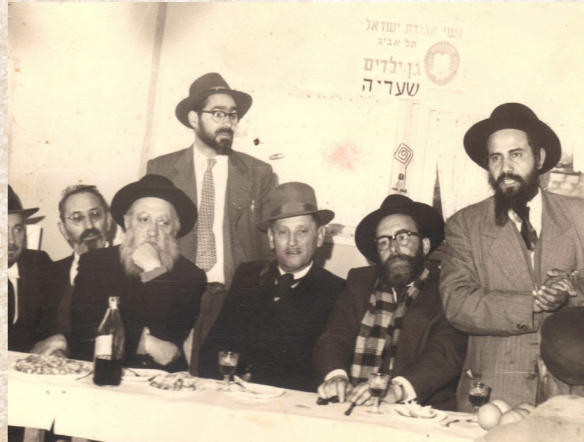
בפעילות בשדה החינוך בתל אביב

בלה את פני הבאים, כשבמקום נוכחת אף נציגות רשמית ממדרגה ראשונה - שר התחבורה דאז, מר שמעון פרס. לא היה זכר ליום השבת.