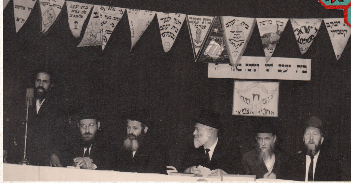
נואם באירוע של 'בית יעקב' - כניוס כחות כ' באיוזר המרכז