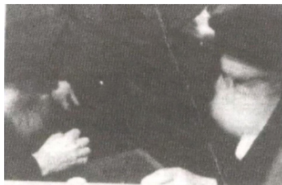
האדמו"ר מגור [הלב שמחה] ביחידות' אצל כ"ק אדמו"ר

אחרי מנחה בירך כמה נוסעים, ביניהם הרב בנימיני מברזיל, בנסיעה טובה ובשמיעת בשורות טובות ובכתובה וחתימה טובה וברכת מזל טוב (לרגל נישואי בנו).