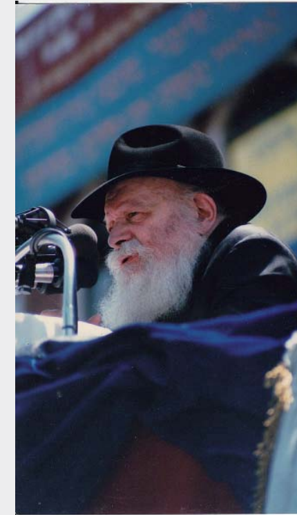
עינים צופיות. כ"ק מן מליובאוויטש ז"ע

ראשי ישיבות שמתראיינים בעילום שם; בכירי מערכות הביטחון שחושפים רגעים, והסוד הגדול שעדיין לא פוענח