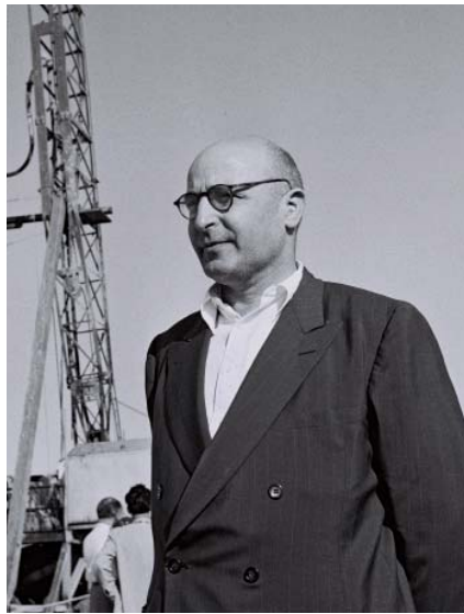
דחיפה ועידוד. שר האוצר פנחס ספיר

"לפני מספר שנים, הזדמנתי להרצות בארה"ב בכינוס שבו השתתפו כל בוגרי המחזור שלי. בקצה