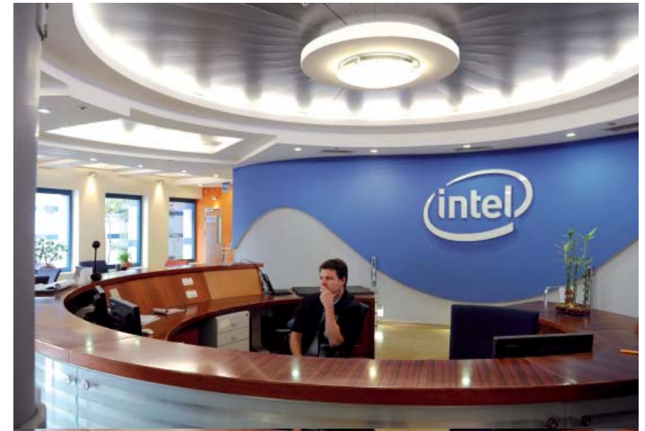
השקעה ששווה מיליארדים. חברה אינטל בארץ