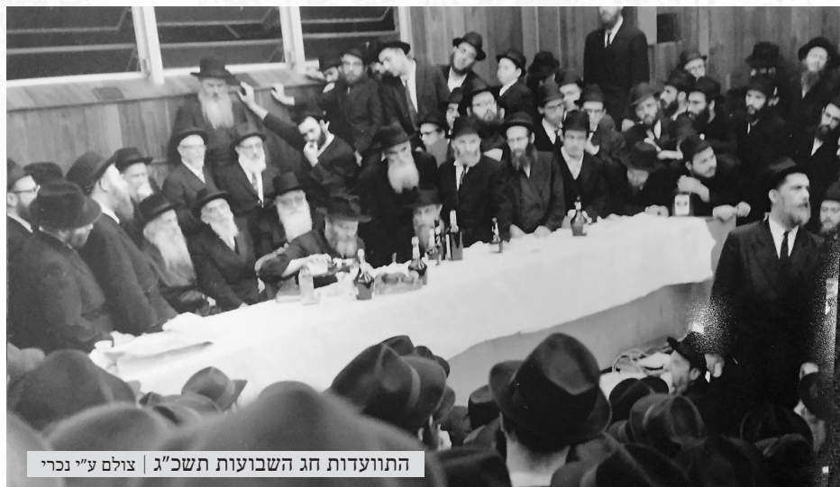
התוועדות חג השבועות תשכ"ג

בשנת תשכ"א דיבר הרבי בהתוועדות על יוקר הניגונים ובמיוחד על המוסד נ"ח"ח, אשר שמו - שניתן לו ע"י הרבי הרי"צ - מאפשר להפיץ את מעיינות החסידות חוצה.