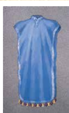
מעיל הכהן הגדול

שהיא ב"קול רעש גדול" מתוך המאבק עם הרע, והכהן הגדול יצג בעבודתו גם את אלה הנמצאים בשולי המעיל שזקוקים לעבודת התשובה. אך גם יהודים אלה הם 'רמונים' - שתוכם מלא במצוות פרמון. גם כיום, העבודה שלנו היא להשמיע קול ולעורר יהודים לתשובה ב'שטורעם' גדול.