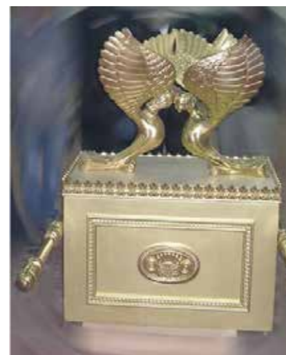
ארון הברית והכרובים

אבא/אמא: הכלי החשוב ביותר היה ארון הברית בו הנחו הלוחות בהם חקוקים עשרת הדברות. הארון היה מנח במשכן באהל מועד, ובבית המקדש בקדש הקדשים.