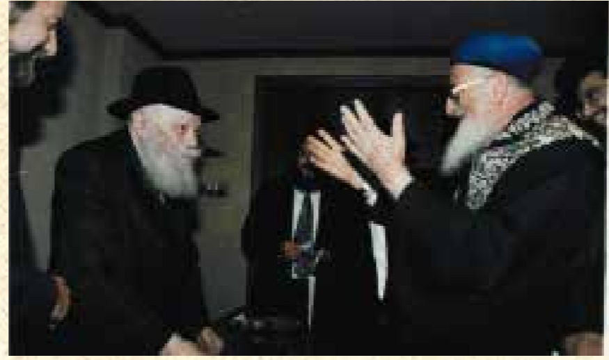
הרב מרדכי אליהו בבקור אצל הרבי, חשון תשנ"ב

ומחכה לכל אחד ואחת מישראל שיפתח את הדלת ו'יסחב' את הגאולה לתוך החדר!"