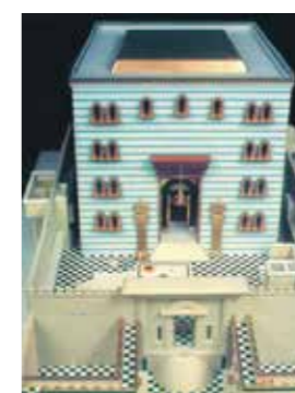
בניו ההיכל, הפולל את האולם, הקדש וקדש הקדשים

אבא/אמא: בשולי המעיל היו פעמוני ורמוני זהב. כשהכהן הגדול היה נכנס לעבד בקדש, השמיעו הפעמונים קול. אך למה שמשו הרמונים? מסביר הרבי שהשמעת הקול היא רמז על עבודת בעלי תשובה