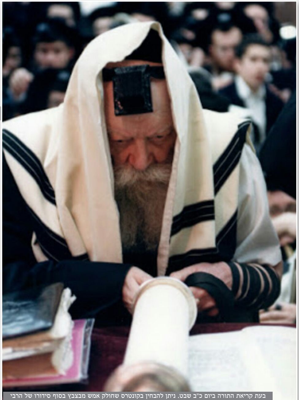
בעת קריאת התורה ביום כ"ב שבט. ניתן להבחין בקונטרס שחולק אמש מבבבץ בסוף סידורו של הרבי

השיחה ארכה כרבע שעה, ותוכנה הי' אודות המעלה של אחד עשר לגבי עשר והשייכות להגאולה ולתאריך כ"ב שבט וכו'. כמו כן הזכיר אודות הכתר האמיתי של מלכות א"ס, כולל גם כפי שהכתר נמשך במלכות בית דוד שהיא מלכות נצחית כתוכן המזמורים פ"ט וצדי"ק שבתהילים. אחרי השיחה כשירד מהבימה והגיע ליד שולחן החלוקה התחיל