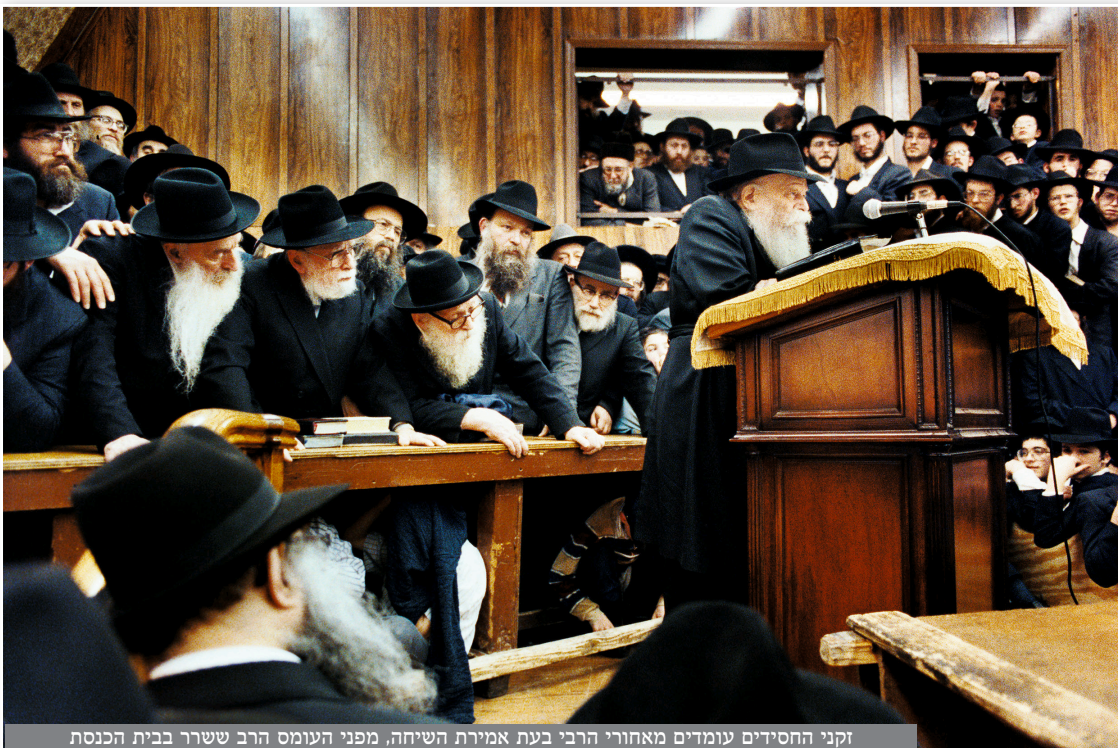
זקני החסידים עומדים מאחורי הרבי בעת אמירת השיחה, מפני העומס הרב ששרר בבית הכנסת

כ"ק אדמו"ר שליט"א ביאר את ההוראה מכל זה ש"חי" ענינה פנימיות ו"מושקא" שענינה ריח מורה על מקיף, וקשור עם "ואלה המשפטים אשר תשים לפניהם" - "תשים" מלשון