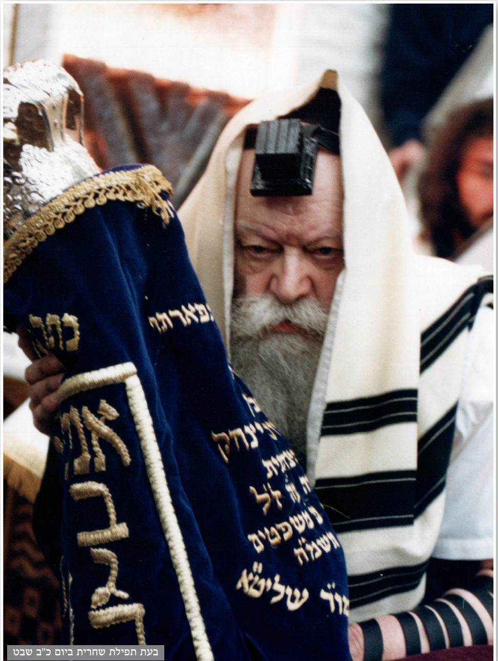
בעת תפילת שחרית ביום כ"ב שבט

לאוהל נסע בשעה 2:55 לערך וכשיצא חילק מטבעות לצדקה למזכירים ולאלו שעמדו שם.