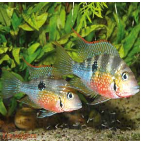
המחלוקת בטומאה בדגים תלויה האם הולכים אחר 'הכח' או אחר 'הפועל'

ב) כללות ופרטות היכן נאמרו. בגמרא (סוטה לו, ב) נחלקו: 'רבי ישמעאל אומר: כללות נאמרו בסיני ופרטות באוהל מועד. רבי עקיבא אומר: כללות ופרטות נאמרו בסיני ונשנו באוהל מועד". לדעת רבי ישמעאל, כאמור, יש להבדיל במצוות בין עיקר לטפל, ובענייניו בין הכללות - העיקריות, לפרטות - הטפלות להן. ולכן סבור רבי ישמעאל שהפרטות לא נאמרו בסיני אלא רק באוהל מועד. אולם לשיטת רבי עקיבא שאין להבדיל בין מצוה אחת