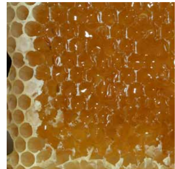
גם בחלות דבש המחלוקת בין ב"ש לב"ה לשיטתם בכל הש"ס

ג) עולת העוף. בגמרא (מנחות צ, ב) נחלקו לגבי חיוב נסכים בעולת העוף: "לפי שנאמר 'עולה' שומע אני אפילו עולת עוף במשמע, תלמוד לומר 'מן הבקר ומן הצאן' - דברי רבי יאשיה. רבי יונתן אומר: אינו צריך, הרי הוא אומר 'זבח' ועוף אינו 'זבח'". רבי יאשיה מצרף את כל סוגי העולות לכלל אחד וממילא לדעתו המילה 'זבח' כוללת גם את עולת העוף, ואילו רבי יונתן רואה בסוגים השונים - פרטים נפרדים, כך שזבח כולל רק את הסוג