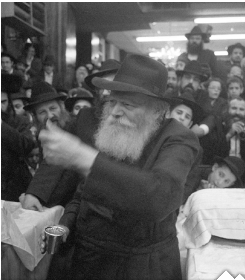
JEW/THE LIVING ARCHIVE/16849