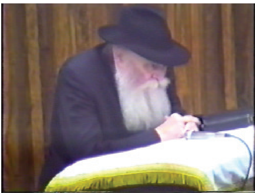
הרבי בעת אמירת השיחה

אבא/אמא: ויהי רצון שימצא מכם אחד, שנים, שלושה, שיטכסו עצה מה לעשות וכיצד לעשות, ועוד והוא העקר - שיפעלו שתהיה הגאולה האמתית והשלמה בפעל ממש, תכף ומיד ממש, ומתוך שמחה וטוב לבב.