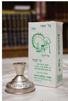
הפרסומת על קופסת הנרות לצד הפמוט המפורסם

המדובר הוא כאמור ב'קופות הצהובות' שהפכו לנכס 'צאן ברזל' בעם ישראל.