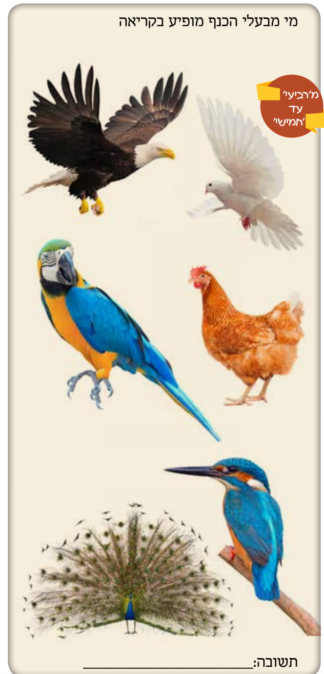
מי מבעלי הכנף מופיע בקריאה

« בַּחֹדֶשׁ הַשְּׁלִישִׁי לְצֵאת בְּנֵי־יִשְׂרָאֵל מֵאֶרֶץ מִצְרָיִם בַּיּוֹם הַזֶּה בָּאוּ מִדְבַר סִינַי: = וַיִּסְעוּ מִרְפִּידִים וַיָּבֹאוּ מִדְבַר סִינַי וַיַּחֲנוּ בְּמִדְבַר וַיִּחַן־שָׁם יִשְׂרָאֵל בְּגֹד הַיָּרְדֵּן: וּמֹשֶׁה עָלָה אֶל־הָאֱלֹקִים וַיִּקְרָא אֵלָיו ה' מִן־הַיָּרְדֵּן לֵאמֹר כֹּה תֹאמַר לְבֵית יִשְׂרָאֵל לְבָנֵי יִשְׂרָאֵל: אַתֶּם רְאִיתֶם אֲשֶׁר עָשִׂיתִי לְמִצְרָיִם וְאַשָּׂא אֶתְכֶם עַל־פְּנֵי נְשָׁרִים וְאַבָּא אֶתְכֶם אֵלַי: וְעַתָּה אִם־שָׁמוֹעַ תִּשְׁמָעוּ בְּקוֹלִי וּשְׁמַרְתֶּם אֶת־בְּרִיתִי וְהִיִּיתֶם לִי סִגְלָה מִכָּל־הָעַמִּים כִּי־לִי כָּל־הָאֶרֶץ: וְאַתֶּם תִּהְיוּ־לִי מִמְּלַכַת כְּתַנִּים וְגַוִּי קָדוֹשׁ אֵלֶּה הַדְּבָרִים אֲשֶׁר תִּדְבֹּר אֶל־בְּנֵי יִשְׂרָאֵל: