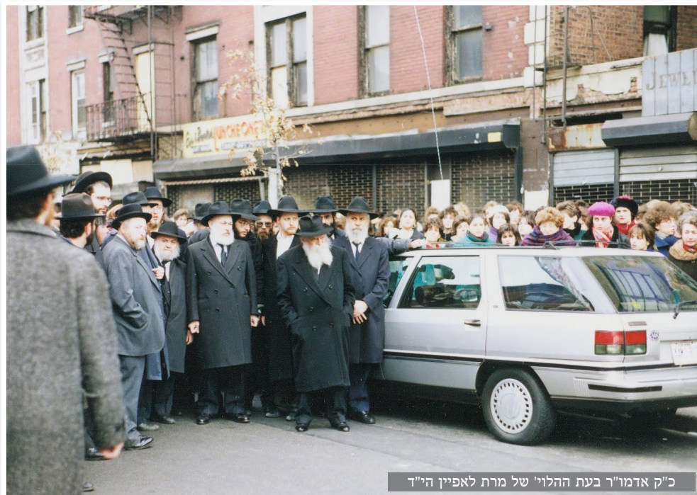
כ"ק אדמו"ר בעת ההלוי של מרת לאפיין הי"ד

כ"ק אד"ש הדגיש את מעלת העשירות, שעל כאו"א להשתדל ככל התלוי בו להיות עשיר בפשטות כן הסביר ש"בריא מזלי" בחודש אדר ענינו כפשוטו שעל כל יהודי להיות בריא וחזק ("געזונט און שטארק") • יומן מבית חיינו