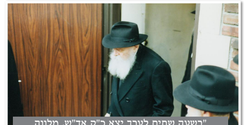
"בשעה שתיים לערך יצא כ"ק אד"ש, מלווה במזכירים, ממלמל בפיו ופניו הק' היו מאוימות"

בשעה שתיים לערך יצא כ"ק אד"ש, מלווה במזכירים, ממלמל בפיו ופניו הק' היו מאוימות. כ"ק אד"ש הביט