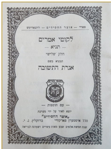
תצלומי השער והעמודים הפותחים של 'אגרת התשובה' שהודפסה במהדורה מיוחדת, תשכ"ח

364 (ואילך) הקדיש הרבי את שתי השיחות הראשונות לענין התשובה, ובהמשך ביאר בהרחבה את דעת הרמב"ם בענין התשובה וגם את דברי אדמו"ר הזקן באגרת התשובה, כשהוא מקשר זאת לסיוס מסכת יומא.