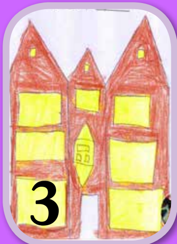
הבית של הרבי. צייר: נתנאל עזריה