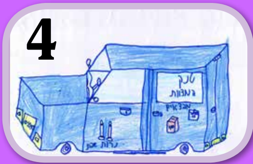
טנק המבצעים. צייר: מאיר יוסף רובנקו