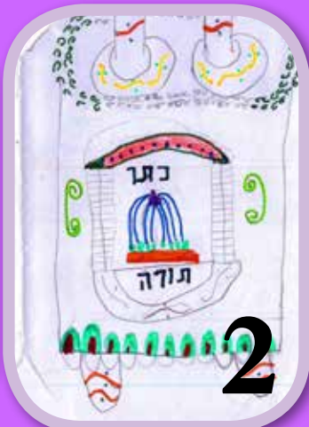
ספר תורה. צייר: אוראל נוסרתי