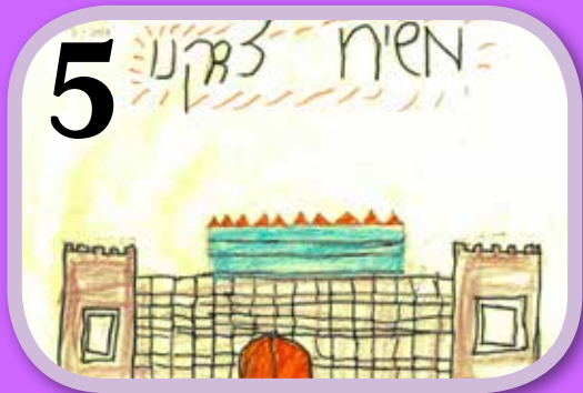
משיח צדקנו. צייר: יצחק לוריא ארביב

ובהתקשרותם. דבר זה מעורר את כחותיו הפנימיים של זה שמתבוננים בו. גדלי