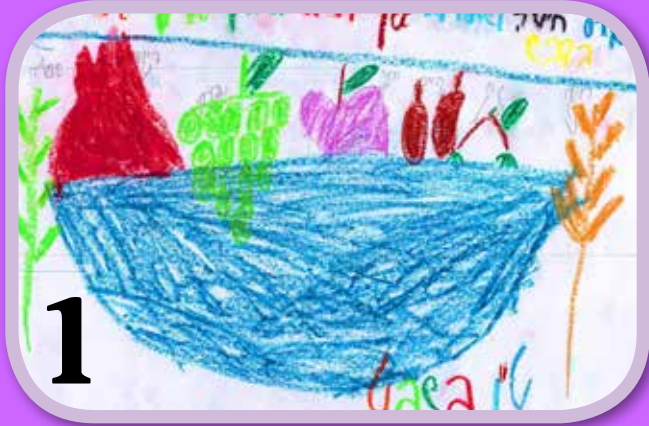
פירות ט"ו בשבט