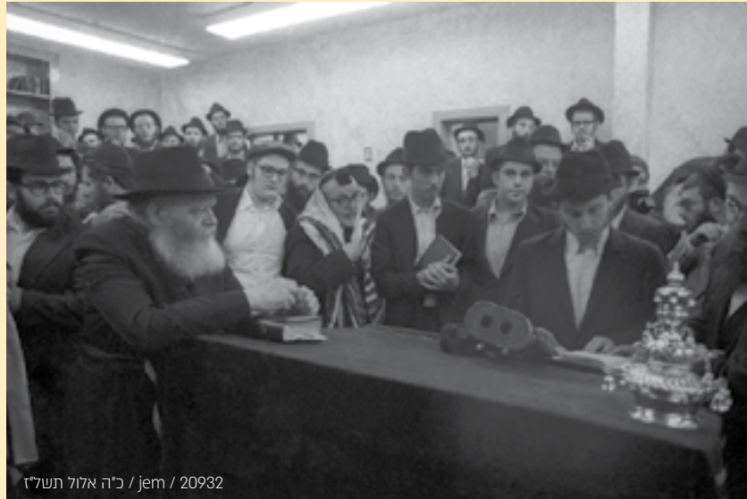
כ"ה אלול תשל"ז / jem / 20932

הראשונה שאמרו לחיים לרבי, היה קשה להם להבחין בדיוק מתי הרבי פונה אליהם). על-כל פנים המשכתי להחזיק בכוס מוגבהת למעלה ושוב הרבי הנהן בראשו אלי, אבל עדיין לא ידעתי בבירור אם הוא מתכוון אלי או לא, ואז פתאום הרבי חיך אלי בפנים צוהבות - ואז הרגשתי שאכן הרבי פונה אלי, ורק אלי... (היתה זו גם הפעם האחרונה שהרבי חיך אלי...).