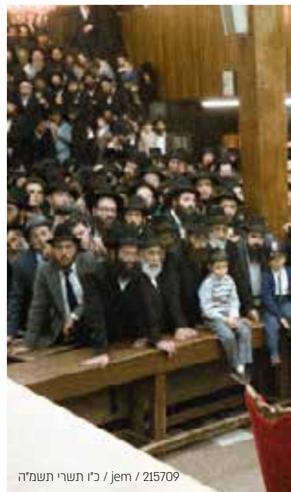
15709 / jem / כ"ו תשרי תשמ"ה

והגישו לרבי את הפ"נ, והרבי העניק להם דולר לצדקה. לאחר שכל האורחים סיימו לעבור, נכנסו החתנים והכלות. גם בפניהם אמר הרבי שיחה קצרה, ולאחר־מכן עברו אף הם לפני הרבי. אחריהם נכנסו חתני בר המצווה ובת המצווה, ולבסוף - במעמד הייחודי לחודש תשרי - קיבל הרבי ליחידות את תלמידי התמימים. בשיחה שביחידות זו, עסק הרבי רבות במעלתם