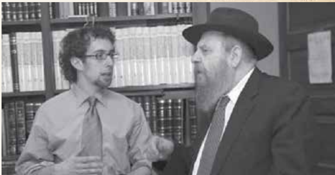
הרב שוחט בשיחה עם סטודנט בעיני יהדות

בספרי החסידות שלהם. מדובר היה בעבודה עצומה, משום שכדי לכתוב ספר כזה צריכים קודם כל ללמוד את כל ספרי החסידות של האדמו"ר האמצעי ואדמו"ר הזקן, ואז לעמוד על ההבדלים הדקים שביניהם... אמרתי לרבי שאנסה, והרבי אמר לי לבקש הכוונה מגדולי החסידים בזה.