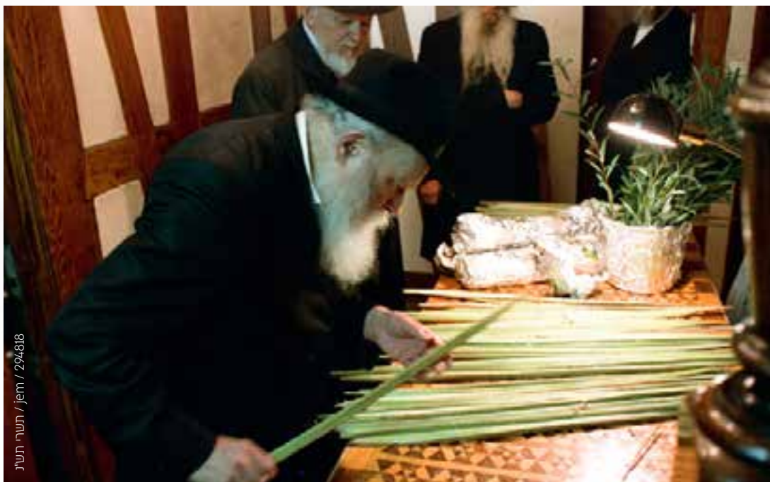
תמונה: תשרי תש"ג / 294818

הרבי נכנס אל 'גן עדן התחתון' ובוחר שם ד' מינים כשרים ומהודרים עבורו. בעת שהרבי מוצא ד' מינים מהודרים זיפים - מאירות פניו הק' בשמחה של מצוה