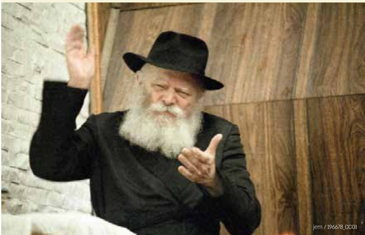
jem / 196678_CC01

במהלך ההקפה הרביעית בליל שמיני־עצרת בשנה זו, הקים הרבי "או"ם: הרבי מינה כמה מהחסידים כ'בעלי בתים' על מדינות שונות ברחבי העולם, ובליל שמחת-תורה, ביקש הרבי מראשי ה"ביג פור" (ארבעת המדינות הגדולות), יחד עם הממונה על ארץ הקודש, שיחליטו יחד עם כל הקהל כי 'ה'