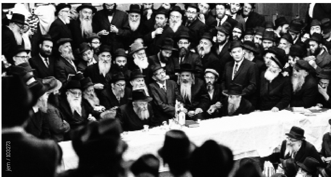
התוועדות שמחת תורה תשכ"ח. התמונה צולמה על ידי נכרי

התוועדות זו היתה ארוכה ביותר, ונמשכה כמה שעות במהלכן אמר הרבי מאמר (עד תשמ"ח) וריבוי שיחות קודש נפלאות, בהן עסק בעניניו של יום על פי תורת הנגלה והחסידות. בדרך כלל, אמר הרבי 'וואַרט' מסוים בנגלה, כהשתתפות ב'כינוס תורה' שיתקיים באסרו חג. כמו כן, עורר הרבי בהתוועדות זו אודות התרומה ל'קרן השנה' (ראה מאסף נרחב בגיליון "בצילא דמהימנותא" ב', שיצא לאור לקראת וא"ו תשרי).