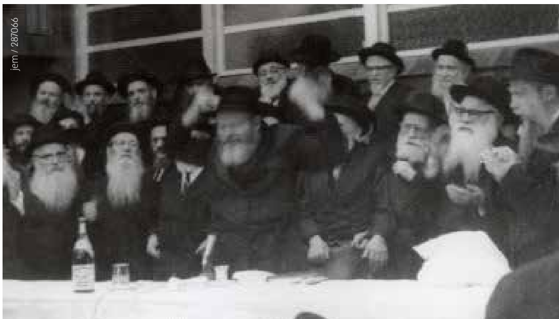
jem / 287066

בלחש), והורה שאחד מהקהל יקדש על היין ויוציא ידי חובה את כל הציבור. לאחר־מכן, התחיל הרבי בשיחות הקודש הנפלאות, ובדרך כלל ביאר הרבי בהתוועדות זו פסוקים מ'אתה הראת'. בין השיחות ניגן הקהל ניגוני שמחה שונים, והרבי עודד בהנפת ידו הק'. לעיתים הרבי אף קם ורקד על מקומו בשמחה רבה.