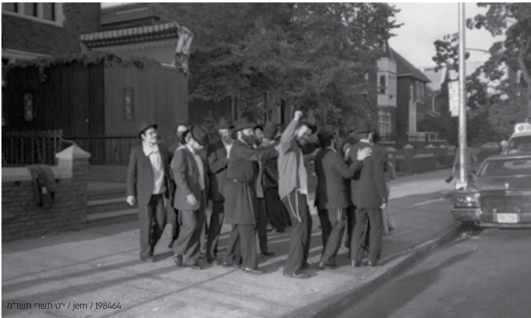
י"ט תשרי תשל"מ / jem / 198464

בימי חול המועד התקיימה 'ועידת צעירי אגודת חסידי חב"ד המרכזית', בה נאמו שלוחים וחסידים רבים מרחבי העולם, שסקרו את פעילויות הפצת היהדות ומעיינות החסידות בשנה האחרונה. מידי שנה, עמד במרכז הוועידה נאמו המרתק של ראש מזכירות הרבי