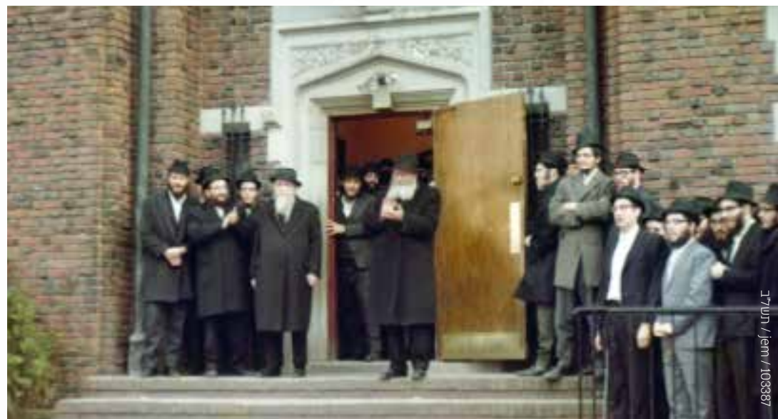
103887 / jem / תשל"ד