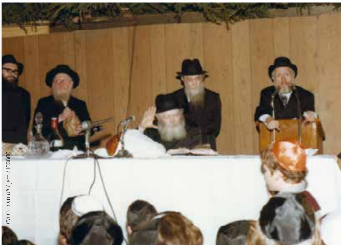
109800 / jem / יו"ט תשע"ו תשל"ז