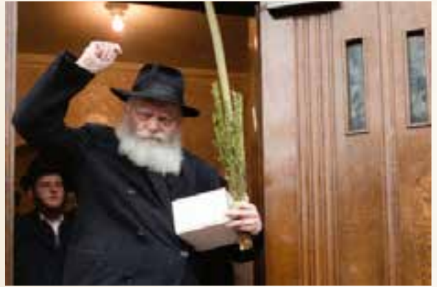
Jem / 201860