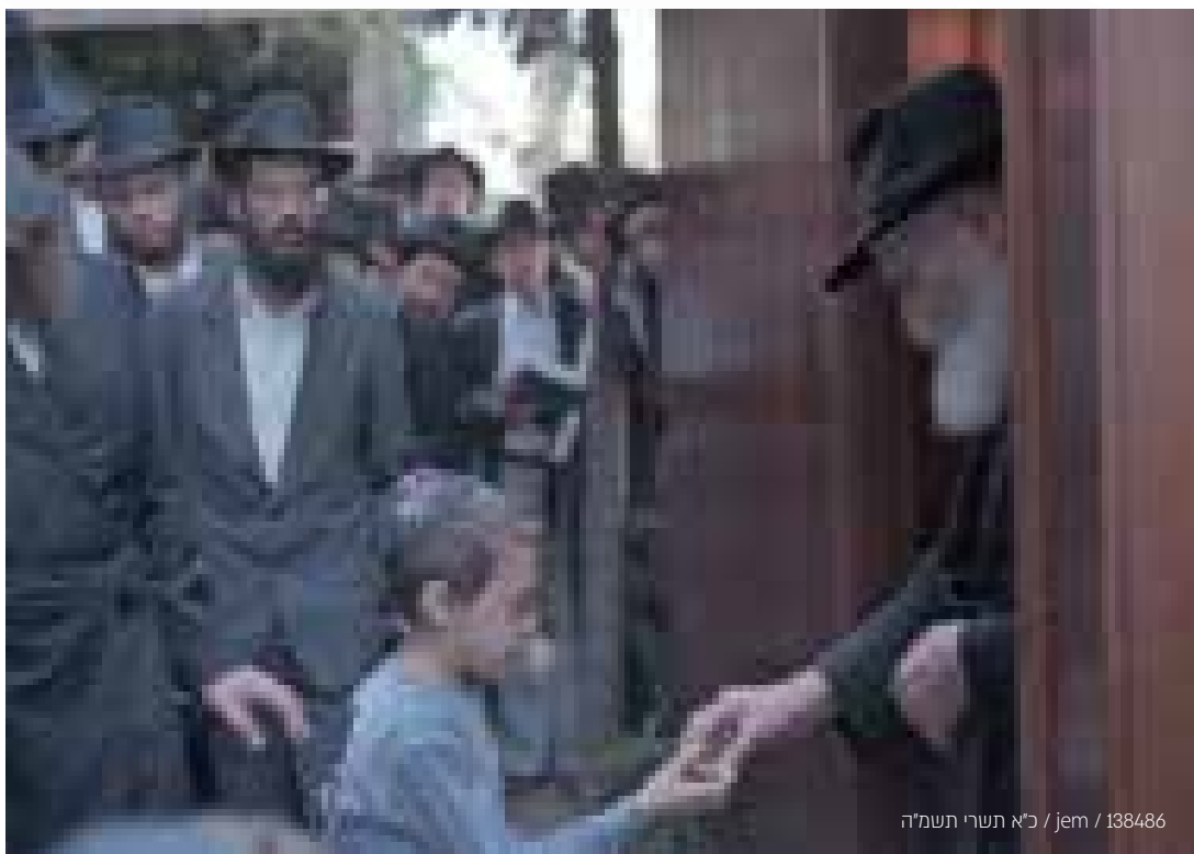
כ"א תשרי תשמ"ה / jem / 138486

בהושענא רבה לאחר תפילת שחרית, היה הרבי מחלק 'לעקאח' לכל אלו שעדיין לא קיבלו לפני כן, כשעומד על יד דלת סוכתו ומברך כל אחד בשנה טובה ומתוקה