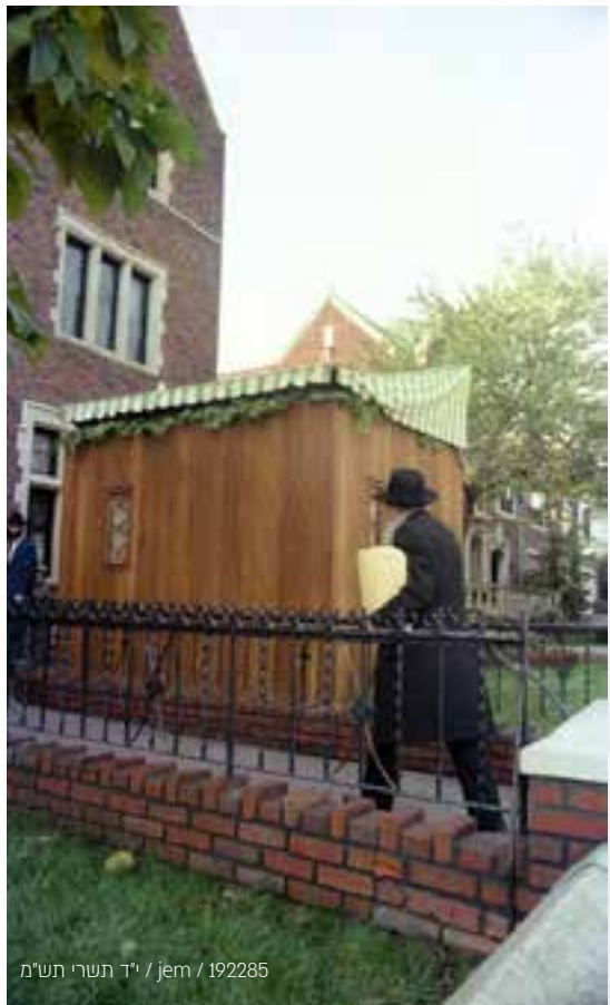
י"ד תשרי תש"מ / jem / 192285

לאחר־מכן המשיך הרבי ודיבר אודות מסירות נפש של החיילים העומדים להגן על גבולות ארץ ישראל, באמרו שכל החיילים הללו הם צדיקים גמורים, שהרי ביום הכיפורים "עיצומו של יום מכפר" על כל העבירות שבתורה... ניכר היה כי הרבי מתאמץ להסיר את