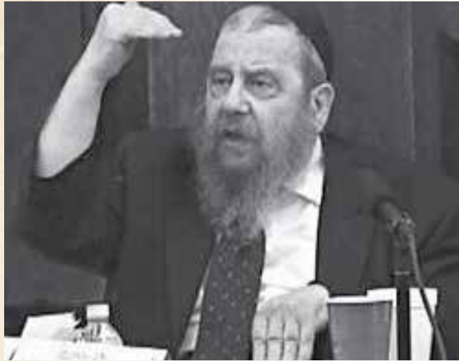
הרב שוחט בויכוח על השקפת היהדות

בפעול, כשהתחלתי לעבוד על זה, גיליתי לפתע שאני ממש "נשאב" לתוך העבודה. איני יודע כיצד להסביר זאת, אך פשוט לא יכולתי להתנתק מהעבודה. הייתי ממשיך במלאכת התרגום במשך לילות שלמים, כשאני מסתייע בספרים רבים המסבירים את המושגים בקבלה המובאים באגרת הקודש, כמו כתבי האריז"ל שבדיוק הוצאו אז לאור, ועוד.