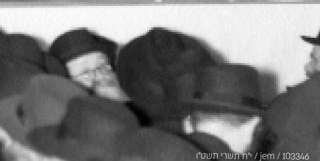
103346 / jem / י"ח תשרי תשט"ו

כל אחת מהמילים "מרכז", "לענייני" ו"חינוך", כשעל-כך נסובה כל ההתוועדות.