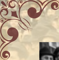
7 / jem / 142612 / כ"ג תשרי תשל"ו