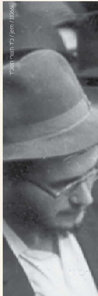
110661 / jem / כ"ד תשרי תשכ"ד

באותו זמן הזקן שלי צמח ומראהו היה לא-מסודר. מאחר וחששתי מתגובת כלתי לעתיד, שלא הגיעה ממשפחה חסידית,