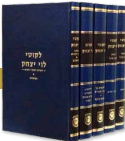
את הכתבים שנאלו הוציא לאור בן המחבר, הרבי מלובביץ'

רבי לוי יצחק אף הוסיף והצהיר: “אסע לנשיא רוסיה, לקאלינין, ואעמיד בפניו את העובדות לאשורן. אם תרצו להעניש אותי, הרשות בידכם, אבל לא אתן הכשר למצות שלא נאפו לפי הוראות ההלכה, כפי רצונו של הקדוש ברוך הוא”.