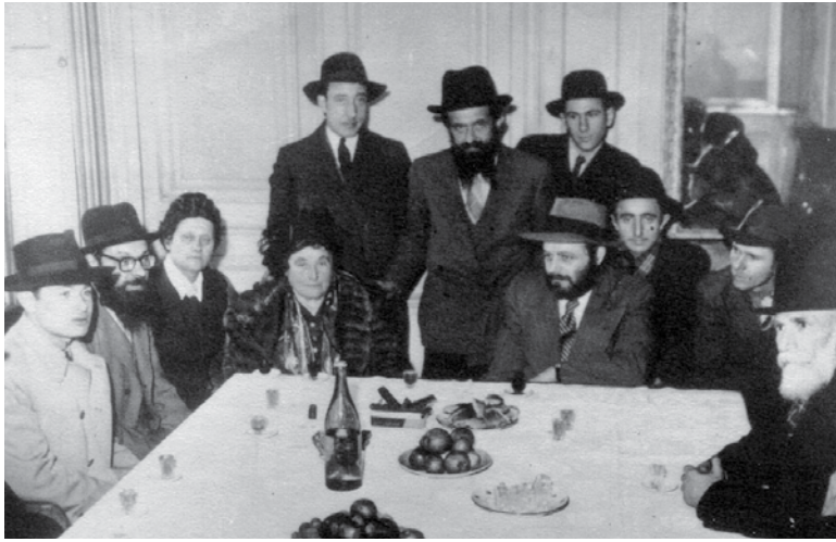
בשנת תש"ז, לאחר שנים שהיתה עם בעלה הרב בגלות שבה נפטר, הצליחה הרבנית חנה לצאת מאחורי מסך הברזל. בנה, לימים הרבי מלובביץ', ששהה באותן שנים עם חותנו הרבי יוסף יצחק בארה"ב נסע לצרפת כדי לקבל את פניה לאחר נתק פיזי של כ-20 שנה!