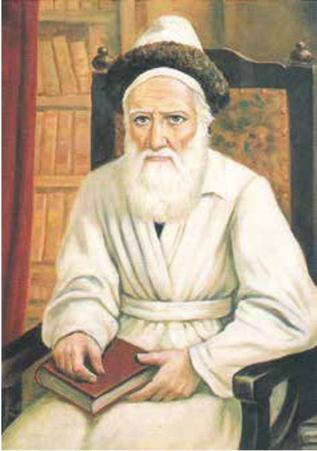
אדמו"ר הצמח צדק' מלובביץ'