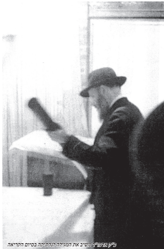
פ"ק אדמו"ר משיב את המגילה לנרתיקה בסיום הקריאה