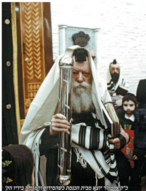
כ"ק אדמו"ר יוצא מבית הכנסת כשהסידור והמגילה בידיו הק'