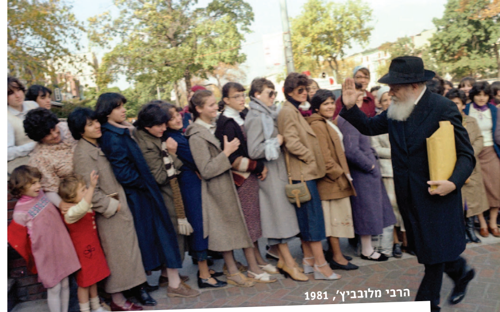
הרבי מלובביץ', 1981