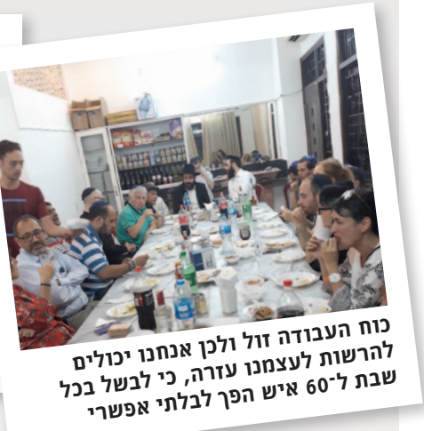
כוח העבודה זול ולכן אנחנו יכולים להרשות לעצמנו עזרה, כי לבשל בכל שבת ל-60 איש הפך לבלתי אפשרי

● והילדים? את חושבת שטוב להם? "הרבי (מלובניץ', מבר"ל) אמר שחינוך ילדי השלוחים הוא על כתפיו, כלומר, הוא לוקח אחריות שהם יגדלו. רואים שאלה ילדים עם קרובה מיוחדת ומהות שונה. אני כמוזן עם אצבע על הדופק כי ראיתי מצוקות אצל ילדים של שליחים אחרים, אז אני ערנית. כשויחיתי שהגדול שלי זקוק לחברה, פניתי לרב. הילדים שלי שמחים ויש כאן כל הזמן אנשים שאוהבים אותם. הם חברים של המטיילים הישראליים, גם אם הם באים והולכים. יש כאן פחות מעשרה ילדים ששני הוריהם יהודים. מי אמר שהרבה חברים זה האידיאל? הילד שלי מאושר. בהמשך הוא אמור ללמוד בבית ספר אינטגרטיבי וזה יהיה אתגר, אבל אני מכריזה את עצמי לחשוב על היום ולא להתעסק בדאגות העתיד, להתמקד בטוב ולחשוב איך להאיר מקום נידח. אין אושר פנימי גדול מזה".