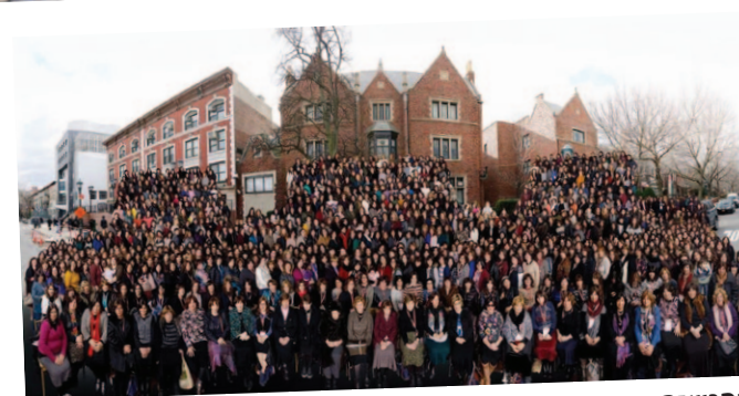
מפגשים מרגשים. כנס שליחות חב"ד, שנערך בשנה שעברה