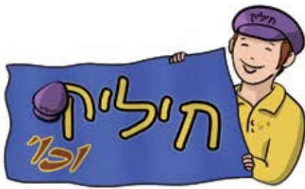
איור וכתובה: מענדי בריל