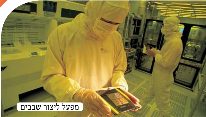
מפעל ליצור שבבים

והופך למשהו אחר. ואז מאירים על פרוסת הסיליקון דרך מסכה מיוחדת, המסכה גורמת לכך שרק חלקים מסוימים של הפרוסה יחשפו לאור. כל קרן אור מורכבת ממיליוני חלקים קטנים של אור והחלקים האלה פוגעים בסיליקון ויוצרים בו חריצים ותעלות, והיכן שהמסכה הגנה על הסיליקון יש בליטות. מדובר בבליטות ושקעים מאוד קטנים בגודל "ננומטר". כדי להמחיש את המידה המזערית הזו, נסביר שאפילו חיידיק יותר גדול מהשקעים הללו: כולנו יודעים מה זה מטר, ובכל מטר יש 1000 מילימטר, בכל מילימטר יש 1000 מיקרומטר, ובכל מיקרומטר יש 1000 ננומטר, כך שאם אנו אומרים שיש בשבב מחשב חריצים בגודל ננומטר... ובכן, זה מאוד קטן.