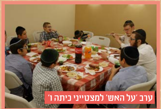
ערב 'על האש' למצטייני כיתה ו'

השבוע נפתח לראשונה בנק "אוצר החייל" בחדר. כל תלמיד קיבל מס' חשבון סודי, שעל ידו הוא יוכל להיכנס לחשבון הבנק שלו, להפקיד, למשוך, ולברר מה היתרה לקנייה בקיוסק שנפתח גם הוא מחדש בשבוע עמוס זה..