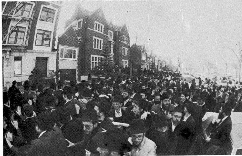
15 דקות לאחר הגעת הבשורה ל-770...

מהלך איסוף החומר, הגשת העדויות והמשפט ע"י חברי אגודת חב"ד שייצגוה במשפט, מנהלי ספריית ליובאוויטש ועורכי הדין המפורסמים, כאשר כל הדוברים הדגישו את העובדה כי בכל מהלך עבודתם נוכחו בעליל בסייעתא דשמיא למעלה מדרך הטבע. בין הדוברים יש לציין במיוחד את הרבנים האורחים הגר"מ לנדא רבה של העיר בני-ברק והגר"מ אשכנזי רבו של כפר חב"ד, הגר"ר מרדכי מענטליק, הגר"ר שניאור זלמן גורארי והרב ר' דוד רסקין — שליט"א חברי אגודת חב"ד, הרבנים אברהם שמטוב ויהודה קרינסקי — מייצגי אגודת חב"ד במשפט, הרב ר' יעקב הגר"מ לנדא כי המקור, בהלכה,